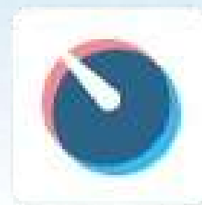
Feuille de temps